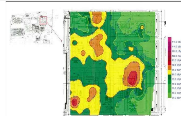
Noise Contour Mapping

This document is used internally for Global Power Synergy Public Company Limited. Any photocopy or printed copy of this document on hardcopy paper is uncontrolled, and is potentially inaccurate or outdated. The most up-to-date, approved and signed-off version is always posted on GPSC intranet.